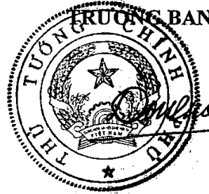
PHÓ THỦ TƯỚNG Vương Đình Huệ

2. Trường hợp cần bổ sung, sửa đổi Quy chế, trên cơ sở đề xuất của các thành viên Ban Chỉ đạo, các Phó trưởng Ban Chỉ đạo báo cáo Trưởng Ban Chỉ đạo Trung ương xem xét, quyết định./